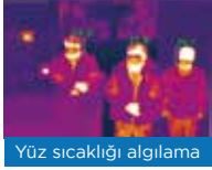
Yüz sıcaklığı algılama